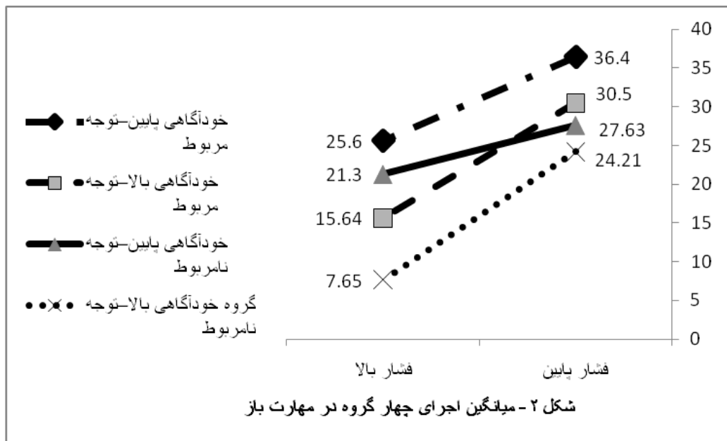
شکل ۲- میانگین اجرای چهار گروه در مهارت باز

شرایط فشار بالا جهت تمرکز توجه از علائم مربوط به تکلیف به علائم نامربوط به تکلیف، تغییر می‌کند. برای تکالیفی که نیازی به توجه کافی ندارند، حواسپرتی تحت شرایط فشار بالا می‌تواند انسداد را تسکین دهد (بامیستر، ۱۹۸۴؛ بیلک و همکاران، ۲۰۰۱؛ سدرتی، ۲۰۰۷؛ لند، ۲۰۰۷).