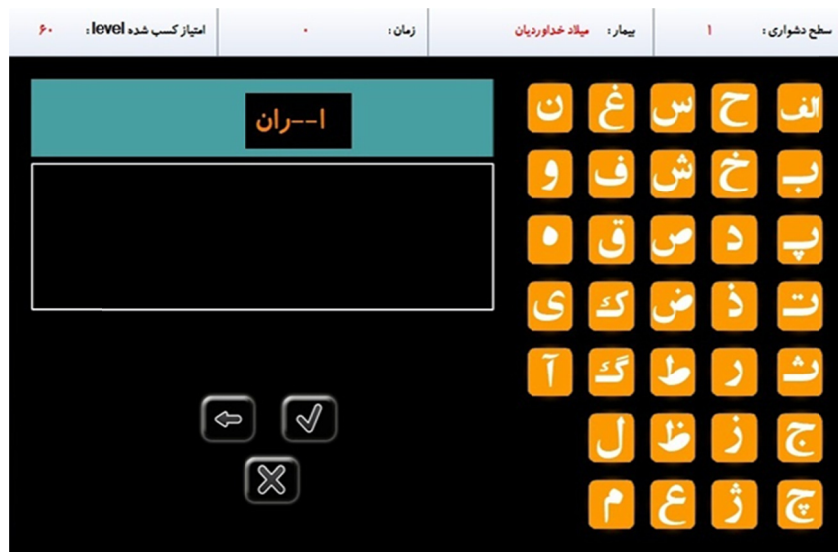
تصویر ۱- نمونه‌ای از تمرینات جهت تقویت حافظه آینده‌نگر

سطح (ب) عدم تشویق حدس زدن و استفاده از روش آزمایش و خطا (ج) ندادن فرصت اشتباه به فرد با دادن سرخ‌های بیشتر برای بازیابی تا رسیدن به پاسخ درست (د) ارائه نمونه و مثال‌های کافی قبل از اینکه از فرد خواسته شود تکلیف اصلی را انجام دهد (و) تصحیح فوری خطاها.