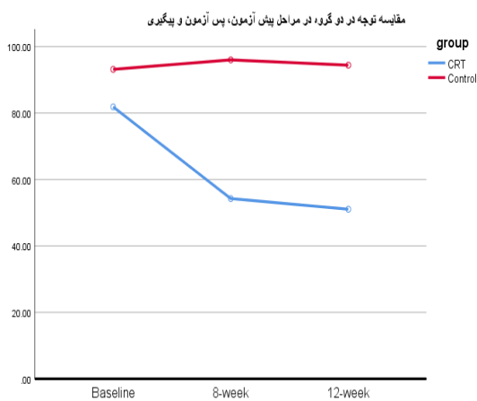
شکل ۳- مقایسه دو گروه در توجه در مراحل مختلف پژوهش