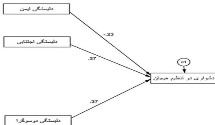
جدول ۷: شاخص‌های برازش مدل